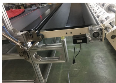
双向激光红外线定位结构