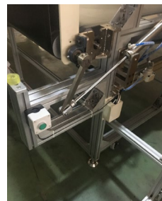
输送机前端有翻板结构