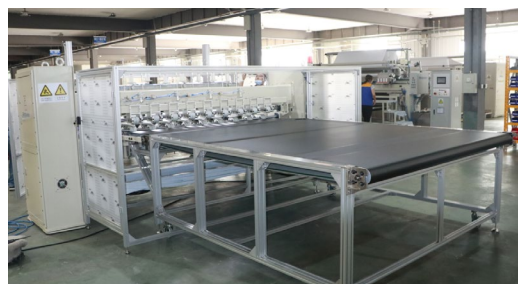
输送机为主动送料, 可调整送料速度