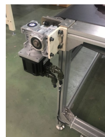
输送机双驱动控制