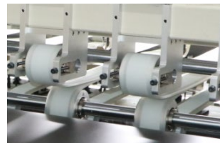
伺服电机独立驱动