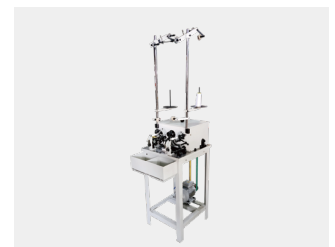
全自动飞梭绕线机