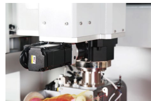
缝纫机头旋转控制台