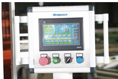
进口Omron PLC 配合液晶触摸屏界面