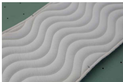
可正反面进行标记，每条拉链最多支持14点位