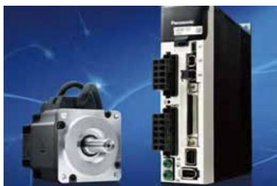
伺服控制系统，保证精度