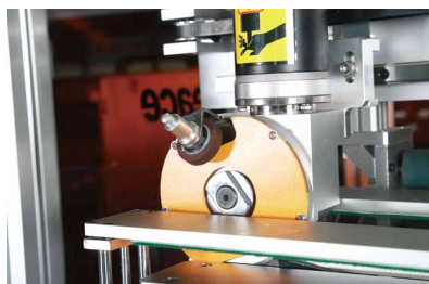
料头定长标记后，自动裁断功能