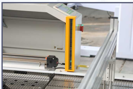
配备安全防护光栅