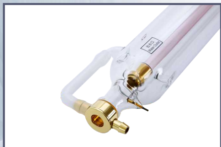
国内知名品牌激光管