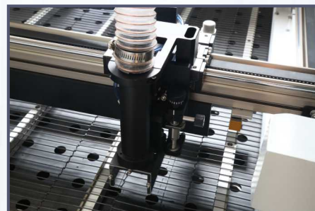
跟随式上吸风装置