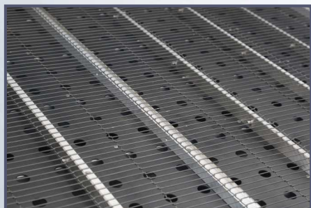
特殊定制工作平台