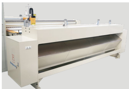
【自动裁切箱】-选配 标配横切装置，可选配竖切装置