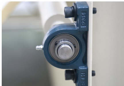
【轴承】 低摩擦，高寿命