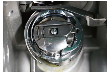
【旋梭】 原装进口大旋梭