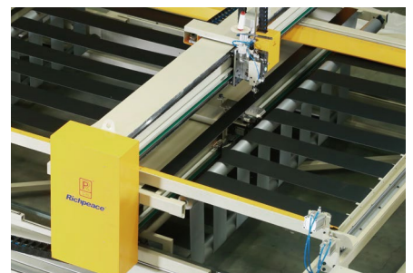
【撑布带装置】-选配 保证绗缝过程物料不下沉，确保绗缝精度