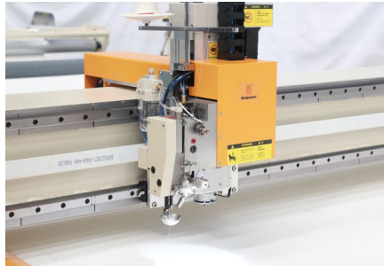
【富怡高速机头】 DLC镀膜，增加高速运动件寿命