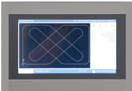
【控制系统】 全触摸控制，ARM工控板，LINUX系统内核，操作简单，工作稳定