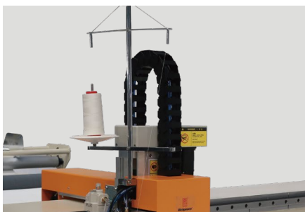
【拖链结构】 结实耐用，使用寿命长