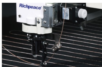
自动剪电阻丝装置