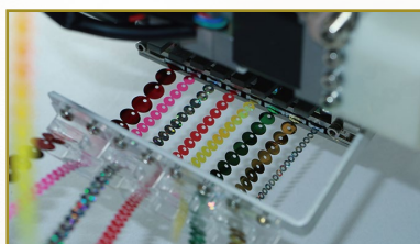
8亮片装置可任意更换 金片规格大小